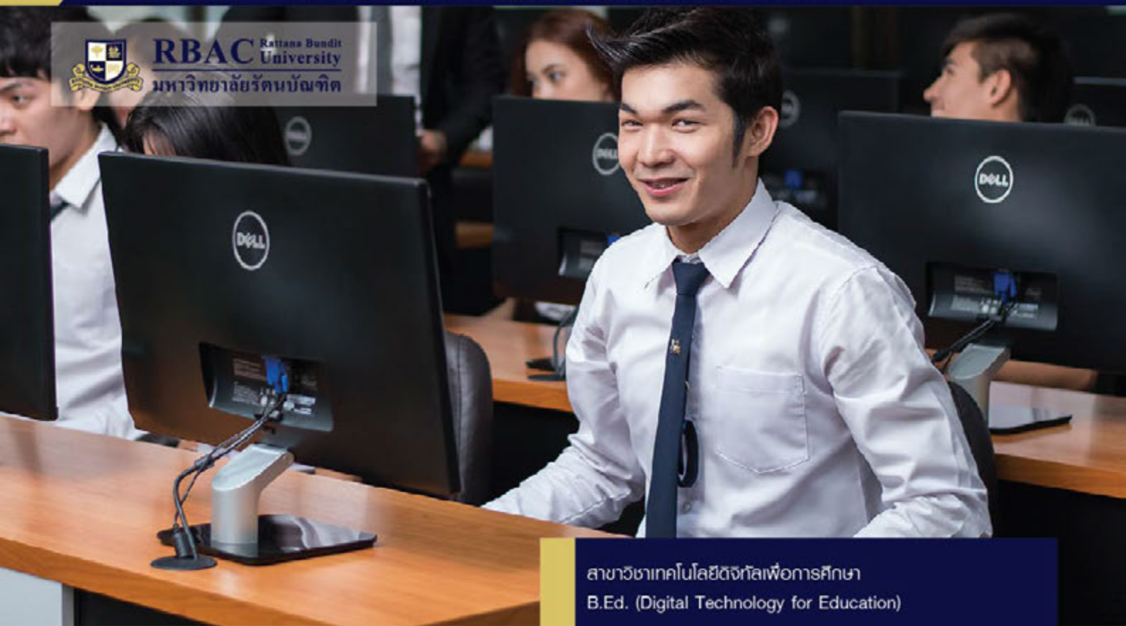
สาขาวิชาเทคโนโลยีดิจิทัลเพื่อการศึกษา B.Ed. (Digital Technology for Education)